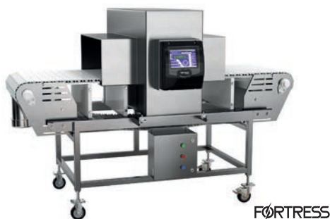
Afb. 3 Fortress BKK banddetector