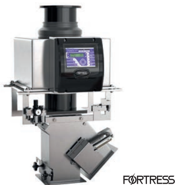
Afb. 2 Fortress vrijeval metaaldetector