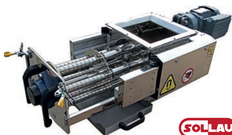
Afb. 1 Sollau roterende magneetseparator